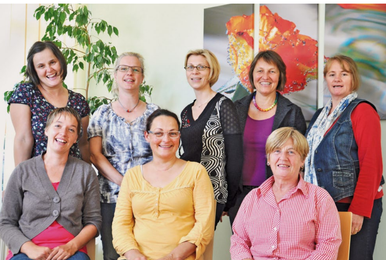
Mobiles Palliativteam Lungau