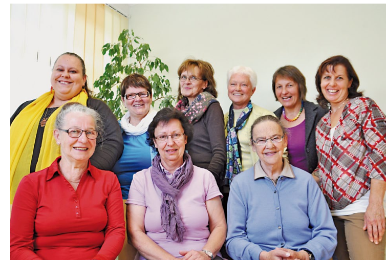
Mobiles Hospizteam Lungau

Palliativbetreuung und Hospizbegleitung bieten eine ganzheitliche Betreuung, in deren Mittelpunkt die PatientInnen und ihre Angehörigen und deren Lebensqualität stehen.